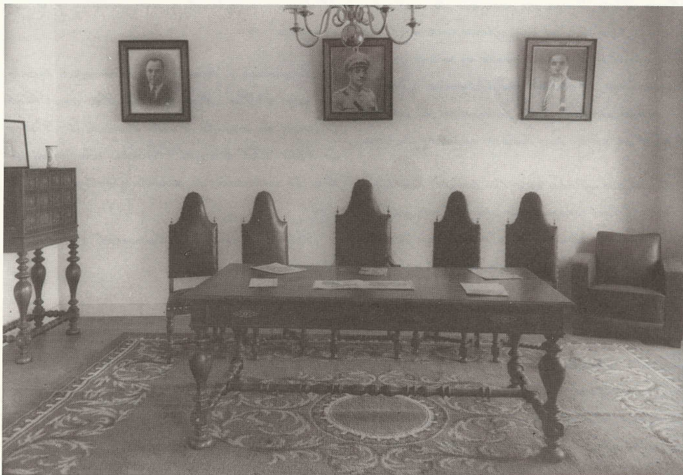
Posto Náutico — Sala do Juiz de Provas